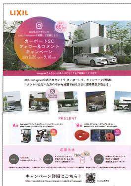
施主さまご案内チラシデータ