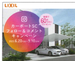
WEBサイト 掲載用バナー