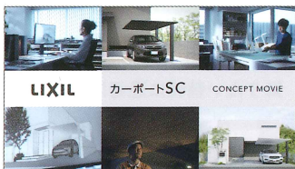
プロモーション動画