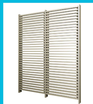
リレーリアスクリーン

キャンペーン参加は、右上のQRコードからキャンペーン申込(1社1名から申込み可能)が必要になります。