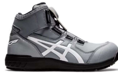
安全靴 CP304 Boa 【ASICS】