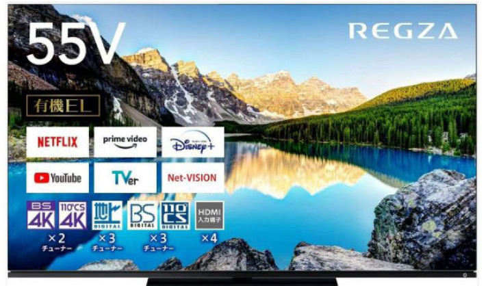
4K有機ELテレビ 55型 X8900L 【REGZA】

※在庫および販売終了により、景品を変更する場合がありますので、ご了承ください。 ※当キャンペーンは、株式会社アメニクスとYKK AP株式会社が独自で実施するもので、 景品の各メーカーが協賛しているものでは、ありません。