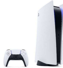
ゲーム機 PlayStation5 【Sony】