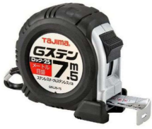
ステンコンベックス 【TAJIMA】