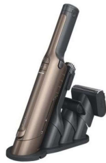
ハンディクリーナー WV405J 【Shark】