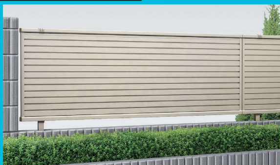
シンプルフェンス・スクリーン