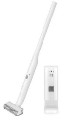
コードレス掃除機 MCNS10K W 【Panasonic】