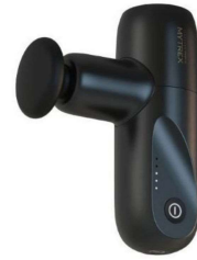
ミニマッサージ ハンディガン 【MYTREX】