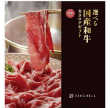
カタログギフト 「選べる国産和牛」 【リンベル】