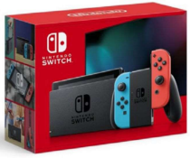
ゲーム機 Nintendo Switch 【任天堂】