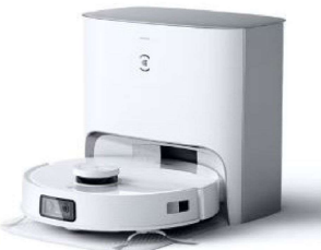
ロボット掃除機 DBX33-22 【ECOVACS】