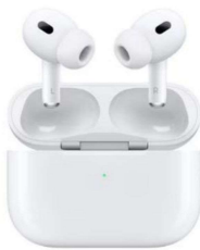
ワイヤレスイヤホン Air Pods Pro 【Apple】