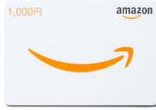
Amazon ギフトカード 2,000円分