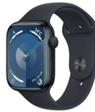
スマートウォッチ Apple Watch 9 【Apple】