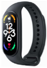
スマートウォッチ Smart Band 8 【Xiaomi】