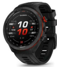
スマートウォッチ Approach S70 【Garmin】