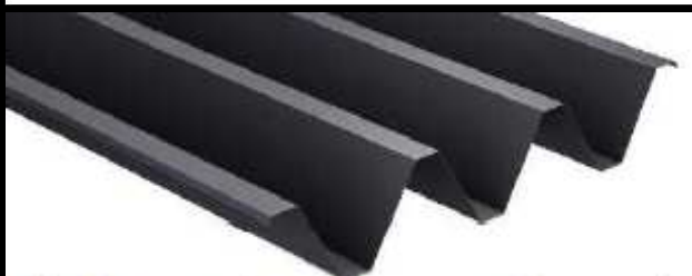
折板上面：つや有り／下面：マット調(イメージ)