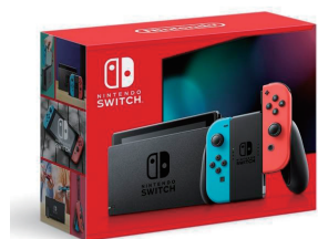
ゲーム機 Nintendo Switch 【任天堂】