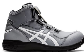
安全靴 CP304 Boa 【ASICS】