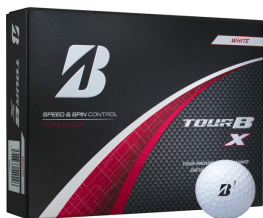
ゴルフボール 12個入り 【ブリヂストン】