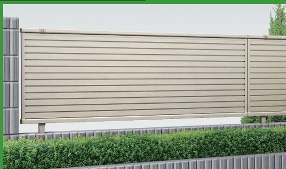
シンプルオフェンス・スクリーン