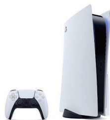
ゲーム機 PlayStation5 【Sony】