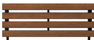
ルシアス・シンプレオフェンス フェンス本体6枚以上 Llteシリーズ、歩行補助手摺除く