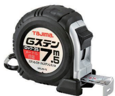
ステンコンベックス 【TAJIMA】