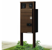
ルシアスポストユニット