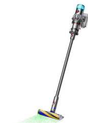
コードレス掃除機 SV46FF 【Dyson】