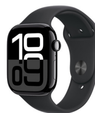
スマートウォッチ Apple Watch 10 【Apple】