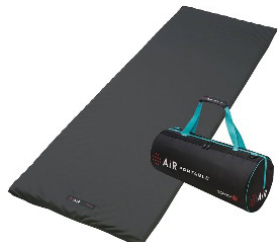
モバイルマットレス 横幅60cm×縦幅180cm 【西川】