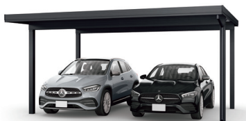
折板カーポート「ジーポートPro」

同じ物件で、下記の3アイテムをご採用いただくと、先着15名様に ノースフェイスのジャンパーをプレゼントいたします。