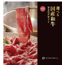
カタログギフト 「選べる国産和牛」 【リンベル】