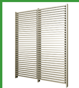
リレーリアスクリーン

キャンペーン参加は、右上のQRコードからキャンペーン申込(1社1名から申込み可能)が必要になります。