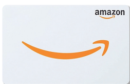
Amazonギフトカード 2,000円分 【Amazon】