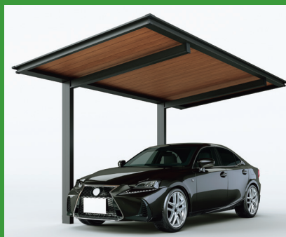
ルシアスカーポート