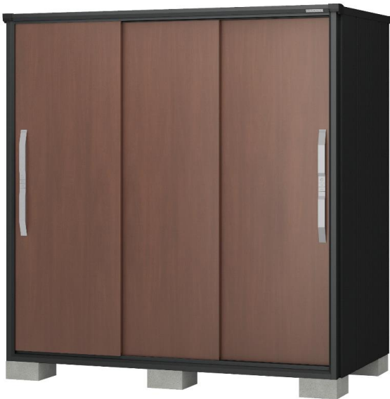
※本体：ブラック 扉色：ウッディマロン

拝啓 貴社ますますご清栄の事とお慶び申し上げます。平素は弊社商品をご愛顧賜り厚く御礼申し上げます。 この度ヨド物置エスモESF型の本体新色「 ブラック 」を5機種限定で発売いたします。 またブラック・エスモ限定の扉色として「 ウッディマロン 」を追加、屋根のコーナー樹脂の形状も変更しております。 つきましては下記に詳細をご案内申し上げます。何卒ご高覧の上、引き続きご愛顧賜りますようお願い申し上げます。