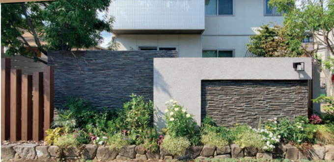
そらやLandscape/(有)モリタ様 使用製品：ノヴェルプレート