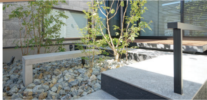
(株)庭彩様 使用製品：ニュートベンチ