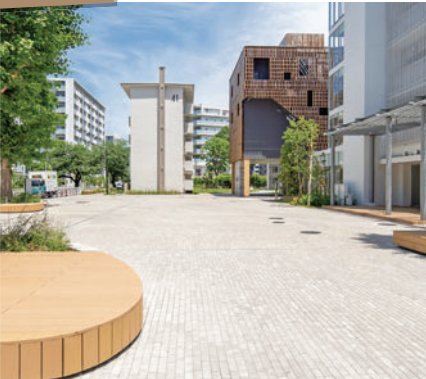
(株)E-DESIGN様 使用製品：グランデペイブ/TOYOプレキャスト平板