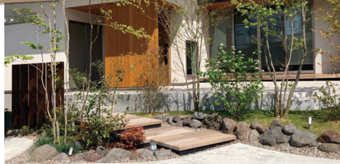
(株)砂土居造園様 使用製品：レイルスリーパーペイブ