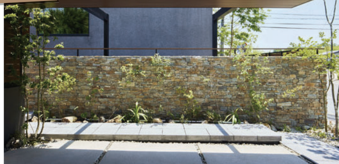
(株)広島美建様 使用製品：ロッツプレート/笠石/ダルストーンステップ/ダルストーンペイブ/和石