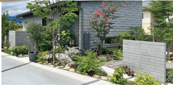
(株)庭企画様 使用製品：モデリート/ボーディウォール800