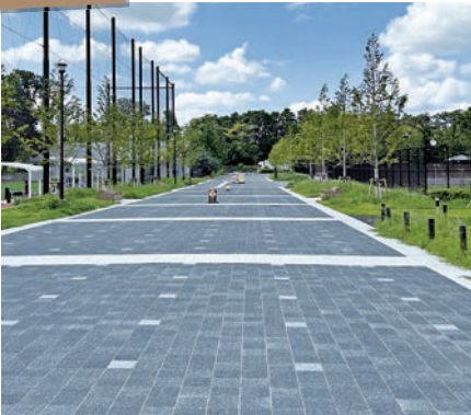
(株)総合設計研究所様 使用製品：ベーシックペイブ02/キセキ