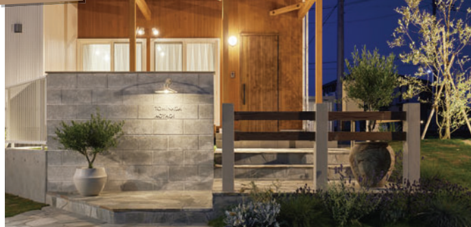
SENSE(株)様 使用製品：ラファイエ/ナチュラルウッドキャップ/ファームフェンス/ グラスハイブリックボーダー/オークルストーン ブルーノ/ソロス