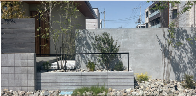
(株)AnFINI様 使用製品：モデリート/TOYOイース ワン