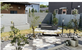
(株)はる様 使用製品：モデリート/ニュートペイブヘキサ