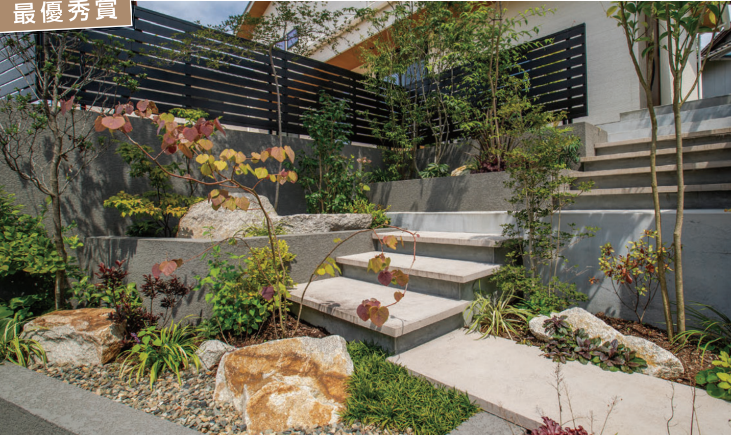
(有)ガーデンアート昌三園様 使用製品：ニュートペイブ