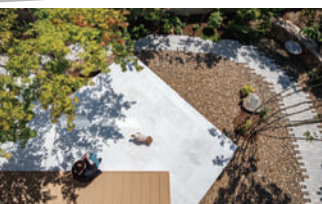
(株)河崎組様 使用製品：ダルストーンペイブ/エクレル