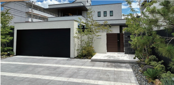
積水ハウス(株) 阪和支店様 使用製品：エクレル