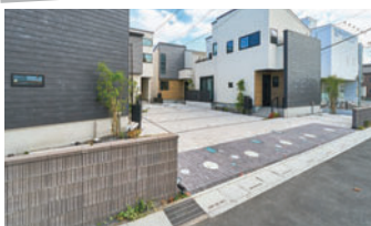
ボラストウン開発(株)様 使用製品：エクレル/コード/ビームベンチ/スリムキャップ