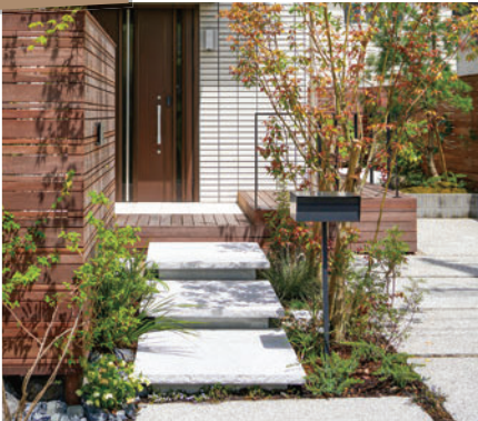
山中育樹園(株)様 使用製品：エトワ