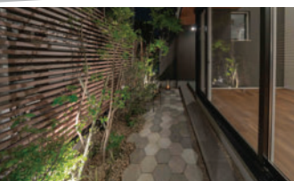
ボラストウン開発(株)様 使用製品：ニュートペイブヘキサ/ビームベンチ