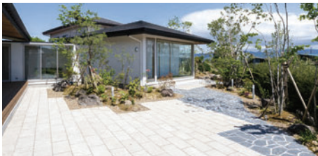
(株)little bear garden様 使用製品：カルムペイブ/オークルストーン エーゲグレー/ クォーリーストーン20/グルバストーン