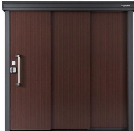
[写真2.ショコラウッド]